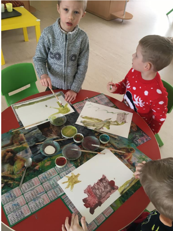
Medus + krāsas